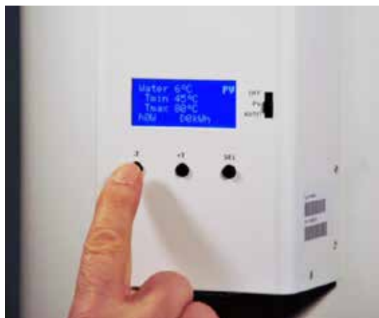
Abb.3 In jeder Wohnung liefert ein SELACAL-Controller Solarenergie für den Warmwasser-Speicher

Emotional fällt es einem Techniker oder Ingenieur nicht ganz leicht, hochwertigen Solarstrom (Exergie) in Warmwasser (Anergie) zu wandeln. Letztlich zählt jedoch, gerade im Mietwohnungsbau, dass neben energetischen auch anwendungsbezogene Kriterien aufeinander abgestimmt werden, wie einfache Installation, Inbetriebnahme, Zuverlässigkeit und Wartung. Verglichen mit der Solarthermie sind zusätzlich einfache Überwachungsmöglichkeiten für jede Einzelanlage gegeben, wie Solarertragsdaten und Fehlerüberwachungsfunktionen. Alle Daten sind für den Anwender direkt am Regler ablesbar (Abb. 3).