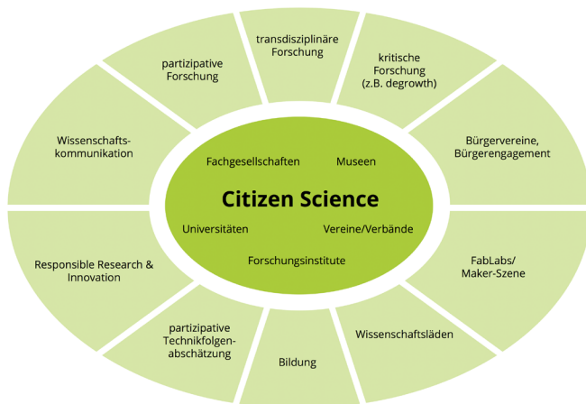
Abbildung 2: Was heißt Partizipation in Citizen Science? Wichtige Citizen Science-Akteure und verwandte Ansätze/Bereiche (eigene Darstellung)

Wichtige Citizen Science-Akteure und verwandte Ansätze/Bereiche