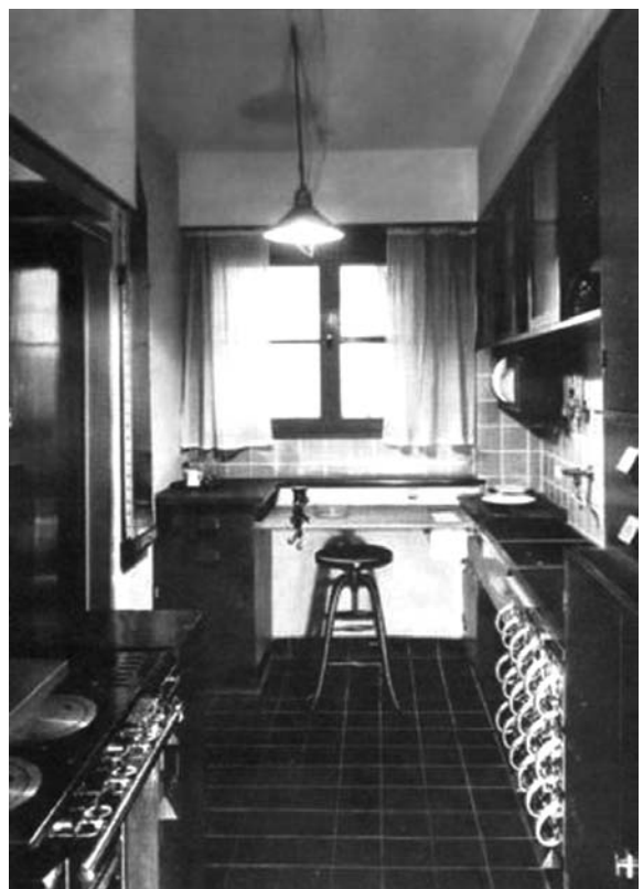
Abb. 4: Frankfurter Küche (Schütte-Lihotzky)