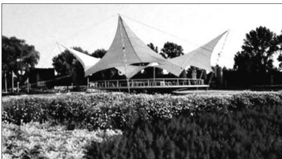
Abb. 2: Zeltkonstruktion von Frei Otto

Zum Glück gibt es noch eine andere Perspektive, aus der sich das vermeintliche Prinzip der Entmaterialisierung interpretieren lässt, wenn wir es nicht länger als Tribut an die Ökonomie und Mobilität, sondern an die moderne Ästhetik verstehen.