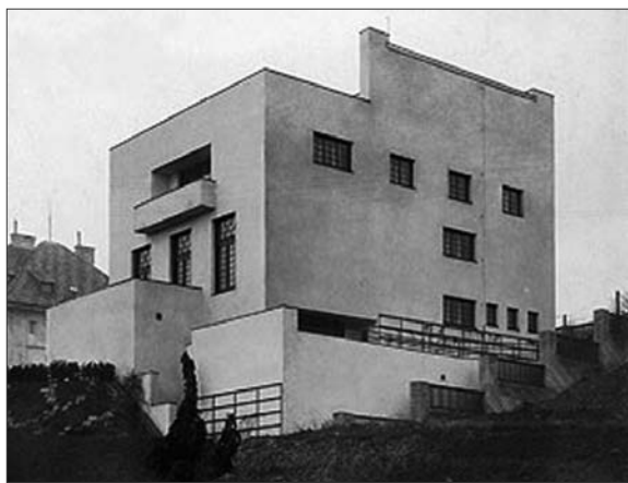
Abb. 5, 6: Opulentes Interieur und schlichte Fassade von Loos