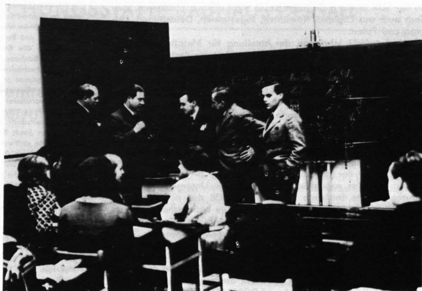
3 Ausstellung Bratislava 1935