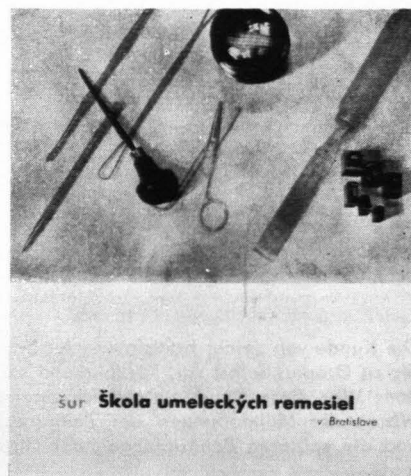
2 Zdeněk Rossmann, Titelblatt einer Werbebroschüre der Kunstgewerbeschule Bratislava. 1933