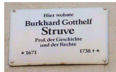
Abb. 6: Gedenktafel am Weimarischen Hof

1732. Sein Grab befand sich auch an der zerstörten Kollegienkirche. Der untere Teil des Grabdenkmals an der Nordwand konnte aus den Trümmern geborgen werden und ist jetzt als epitaph im Tor des Kollegienhofes (Kollegiengasse 10) zu besichtigen. Eine Gedenktafel gibt es auch an seinem Wohnhaus in Jena (heute Weimarischer Hof, Unterm Markt). Er wird dort als Professor der Geschichte und der Rechte bezeichnet.