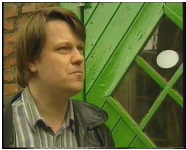
Was für ein Typ