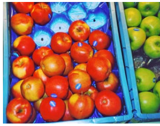
d _ Ap _ _ _ / _ _ _ _