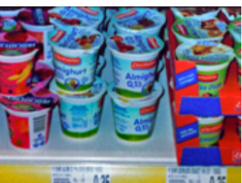
d _ Jog _ _ _ / _ _ _ _