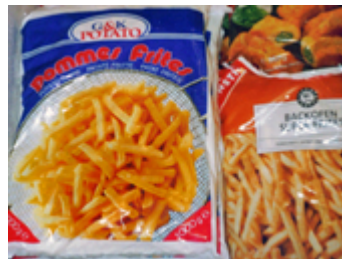
die Pom _ _ _