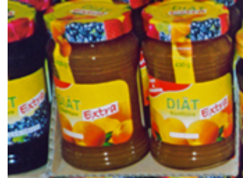
d _ Marm _ _ _ _ /