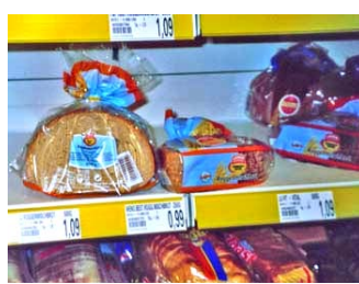
d _ Br _ _ _ / _ _ _ _