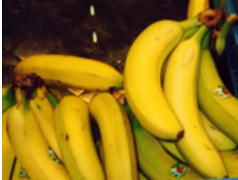
d _ Ban _ _ _ / _ _ _ _