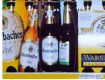
d _ Bi _ _ / die _ _ _ _