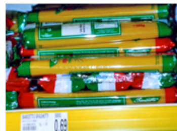
die Spagh _ _ _ _