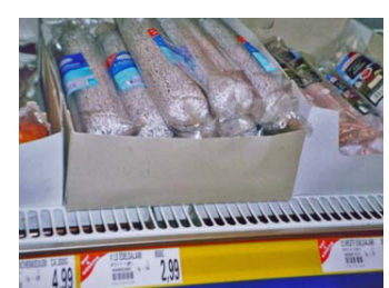
d _ Sal _ _ _