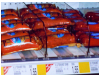
d _ Wu _ _ _ / _ _ _ _