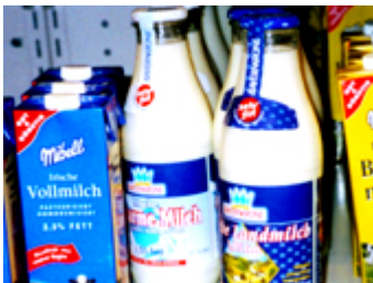
d _ Mi _ _ _