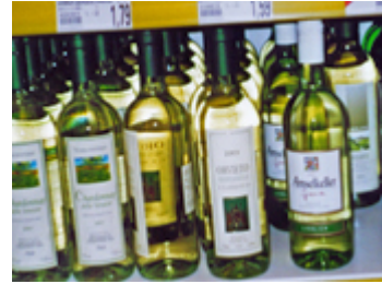
d _ We _ _ / die _ _ _ _