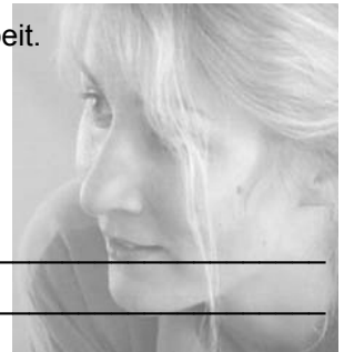
Susanne ist froh.

Susanne ist sehr deprimiert. Robert hat nämlich keine Arbeit.