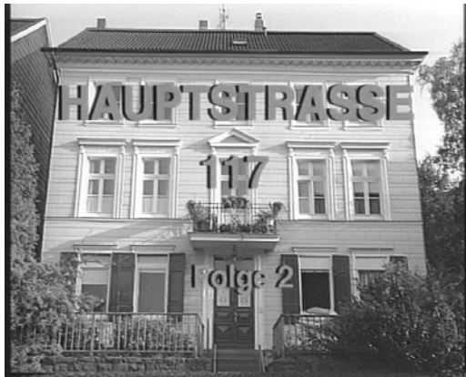
Das ist das Haus Hauptstraße 117

Achtung: There is no upper case of the letter "ß". If you're using capitals, you have to replace „ß“ with “SS”.